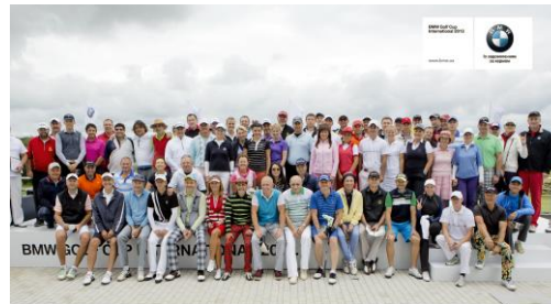
BMW GOLF CUP INTERNATIONAL 2013.